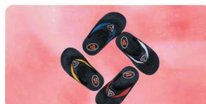
مدل: پوما انگشتی نقلی سایز: ۲۴ تا ۲۹ تعداد درکارتن: ۳۶ زوج رنگبندی: الوان