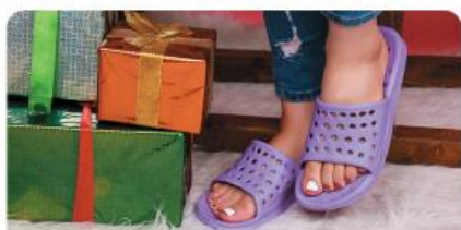
مدل: استخری زنانه سایز: ۳۶ تا ۳۹ تعداد درکارتن: ۲۴ زوج رنگبندی: الوان