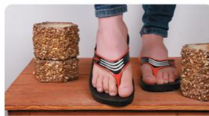
مدل: انگشتی مردانه سایز: ۴۰ تا ۴۵ تعداد درکارتن: ۲۴ زوج رنگبندی: الوان