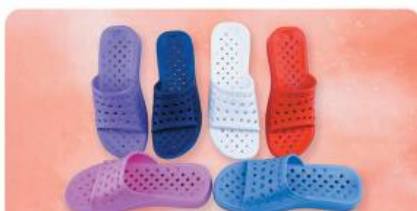
مدل: استخری مردانه سایز: ۴۱ تا ۴۴ تعداد درکارتن: ۲۰ زوج رنگبندی: الوان