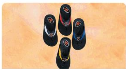
مدل: پوما انگشتی پسرانه سایز: ۳۰ تا ۳۵ تعداد درکارتن: ۳۲ زوج رنگبندی: الوان