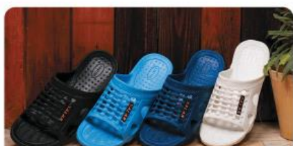
مدل: سالارمردانه سایز: ۴۰ تا ۴۵ تعداد درکارتن: ۲۰ زوج رنگبندی: الوان