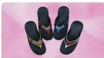
مدل: انگشتی میانه سایز: ۳۷ تا ۴۰ تعداد درکارتن: ۲۴ زوج رنگبندی: الوان