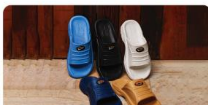
مدل: ارگ مردانه سایز: ۴۰ تا ۴۵ تعداد درکارتن: ۲۰ زوج رنگبندی: الوان